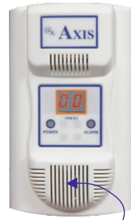
Kordon Tıp Öneriyor

Geçmiş veri tablosu, son bir yıllık çalışmaya kadar tüm parametreleri, döngü adımlarını, uyarı mesajlarını, döngü raporlarını kaydeder.