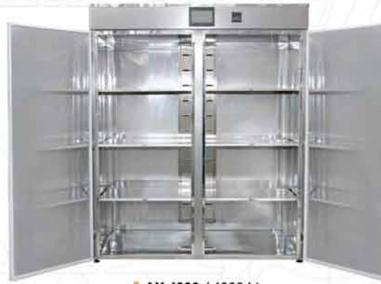
AX 4000 / 4000 Lt.

Pratik, endüstriyel tip etilen oksit sterilizatörleridir. Sterilize edilecek malzemeler, pratik olarak sterilizasyon ampülü ve nem çipi ile birlikte Liner Bag içerisine konulur ve ağı kapatılır. Liner bag, sterilizatörün içine yerleştirildikten sonra, sterilizasyon ampülünün başlığına basılarak sterilizasyon başlatılır. Sterilizasyon ve havalandırma çevrimi sonrası, malzemelerin kullanıma hazırdır. Oldukça düşük oranda, 24 gr lık etilen oksit ampülleri ile çalışır. Cihazın, havalandırma dahil 4 saatlik kısa programı vardır. Opsiyonel olarak, otomatik kartuş aktivatörlü ve havalandırıcı, portatif otomatik yükleme sepetleri kullanılabilir. Çalışma esnasında, sterilize edilecek yeni malzemeleri eklemek ve ayrı çalıştırmak mümkündür. Negatif kabin basıncı göstergisi sayesinde, operatör güvenliği tam sağlanır. Net iç kullanım hacmi yüksektir. Montaj ve kullanım, pratik ve kolaydır.