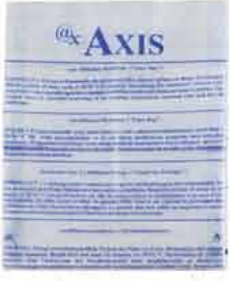
%100 EO Ampül