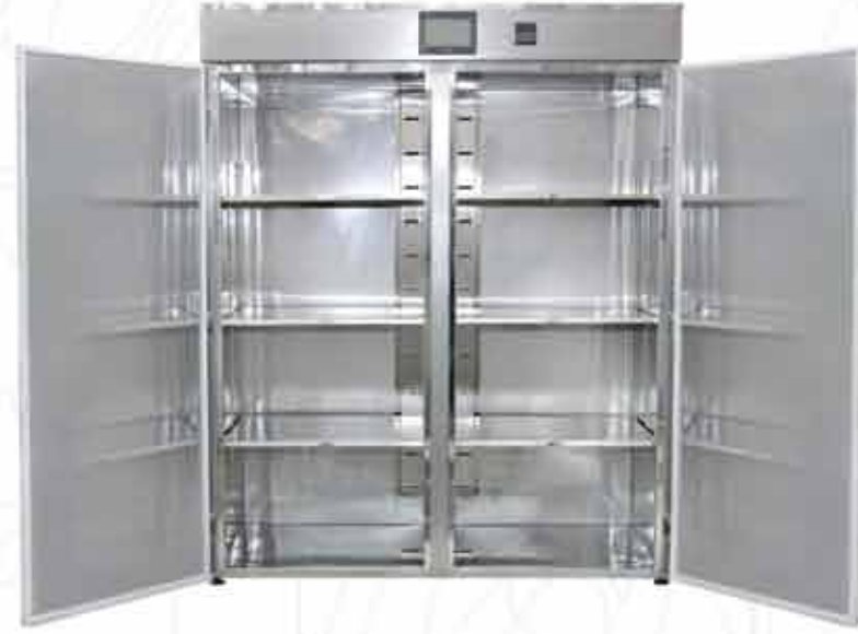
AX 2000 / 2000 Lt.